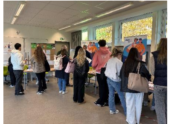
Impression: Markt der Möglichkeiten

Ein besonderes Highlight war der „Markt der Möglichkeiten“ im November. Ihre Auszubildenden konnten dort verschiedene Unterstützungsangebote direkt kennenlernen. Vor Ort waren unsere Schulsozialarbeit, das Lerncoachingteam und die Beratungslehrkräfte. Außerdem vertraten waren die Ausbildungsberatung der Handelskammer, die Jugendberufsagentur, VERA Plus sowie das Azubi Kolleg der Joachim Herz Stiftung. So konnten erste Kontakte entstehen und Hemmschwellen abgebaut werden.