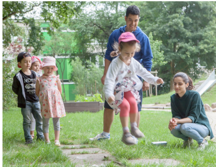
Arbeit in einer Kindertagesstätte

Der Wahlpflichtbereich umfasst einen sog. Profildbereich mit den fünf Schwerpunkten Erlebnispädagogik und naturwissenschaftliche Bildung, Kreatives Gestalten und Medien, Musik und Darstellen, Sprache und Bewegung, Bewegung und Gesundheit. Zusätzlich bieten wir praktikumsbezogene Kurse an, z.B. Erziehung, Bildung und Betreuung in Kitas oder Schulen.