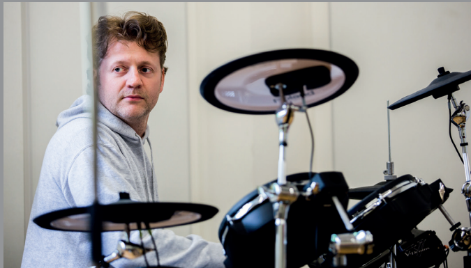
Probe im Musikraum