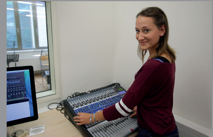
Arbeit im Tonstudio