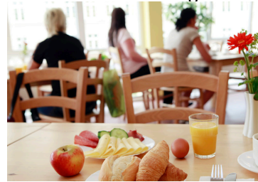
All-You-Can-Eat Frühstück © A&O HOTELS and HOSTELS Holding AG This file is licensed under the Creative Commons Attribution-Share Alike 3.0 Unported license.