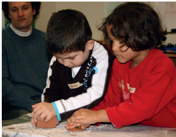
Arbeit in einer Kindertagesstätte

Für den zusätzlichen Erwerb der Fachhochschulreife kann Unterricht in Fachenglisch auf Niveaustufe B2 und Mathematik belegt werden.